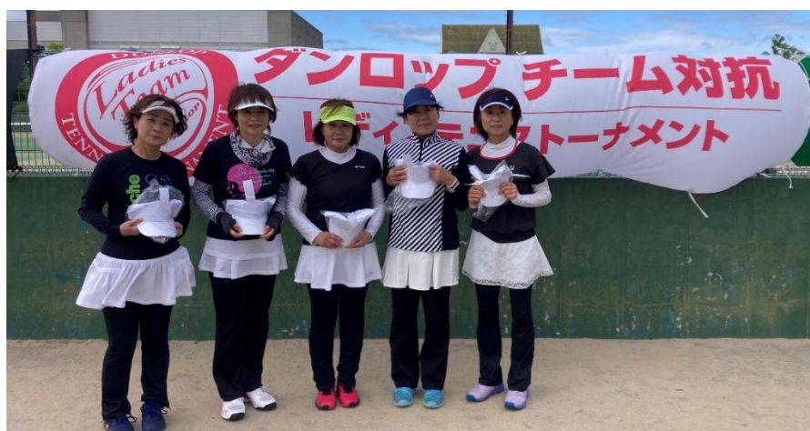
シニア 2位リーグ 優勝 夢のアレの みなさん