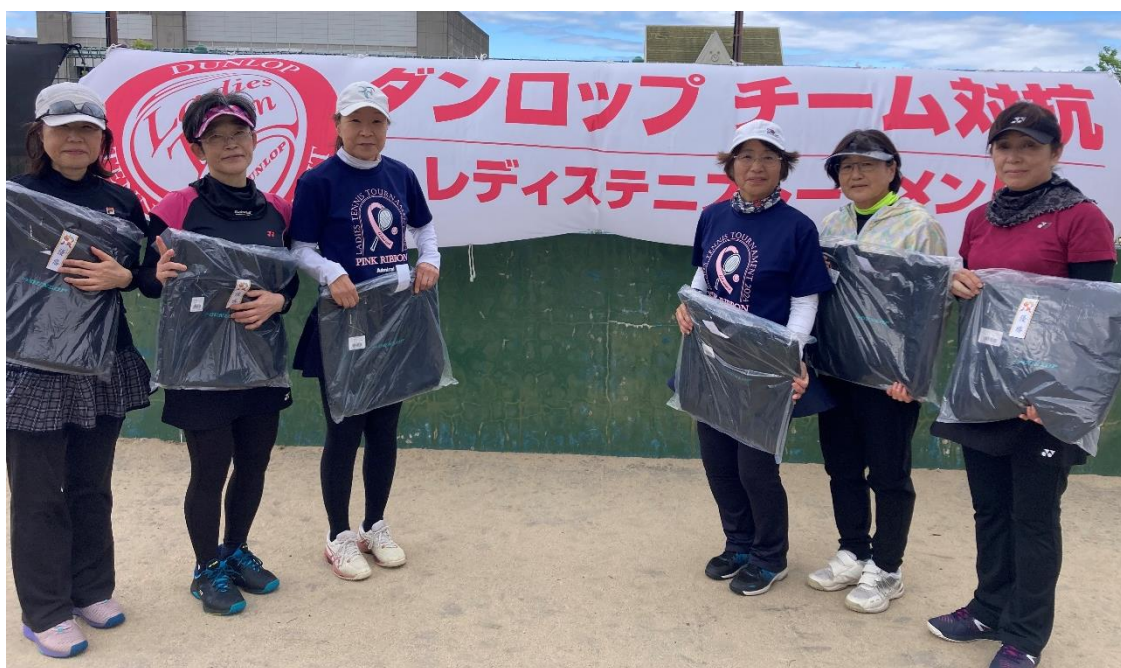
シニア 1位トーナメント優勝 サクラ組のみなさん