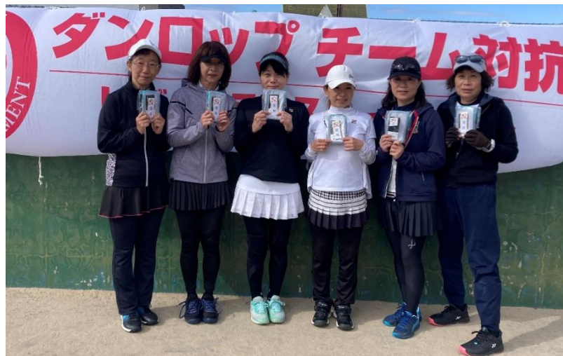
一般 3位リーグ 優勝 えとせとらの みなさん