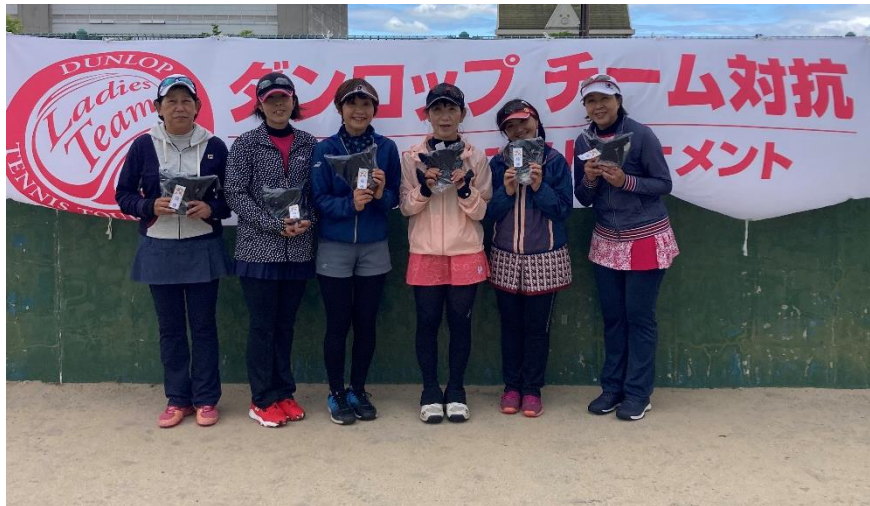
一般 2位リーグ 優勝 集まれテニキチの みなさん