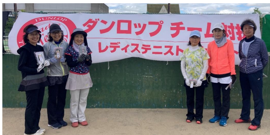
シニア 3位リーグ 優勝 ルンルンテ ニスチーム のみなさん