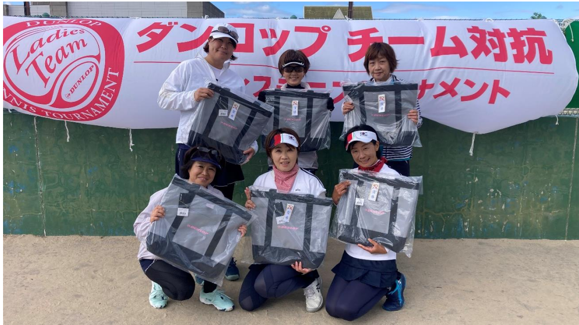
一般 1位トーナメント優勝 最高ですパート2のみなさん